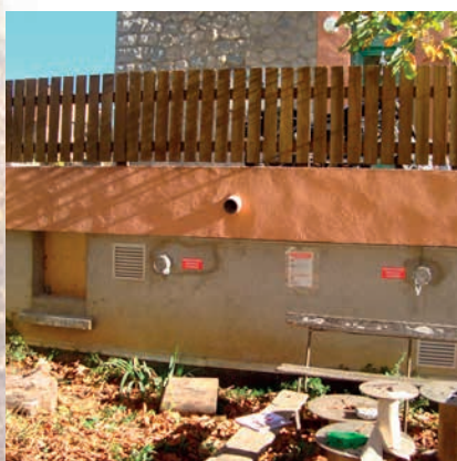
Silo semi-enterré, 17 m 3 Remplissage par camion souffleur via un raccord pompier (bouche)