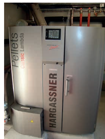
Chaudière Hargassner, 35 kW