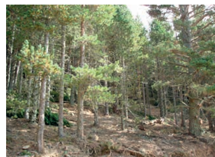
Aspect du peuplement après travaux