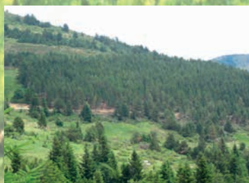
Vue générale du peuplement

Accessibilité : 800m de piste depuis le col de Jau