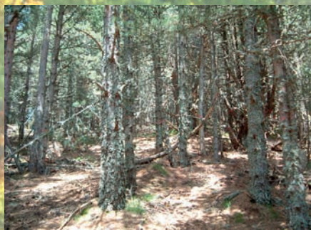
Aspect du peuplement avant travaux

Première éclaircie sélective douce sur le peuplement de pins