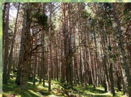
Aspect du peuplement avant travaux

Le chantier prévoit l'abattage/débardage de 562 tiges, équivalent à 537 MAP soit environ 167 tonnes.