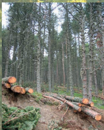
Aspect du peuplement après travaux