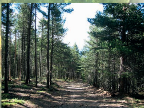
A gauche aspect du peuplement après travaux et à droite avant travaux