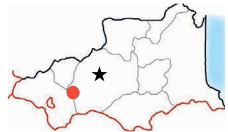
Groupe scolaire de Font-Romeu