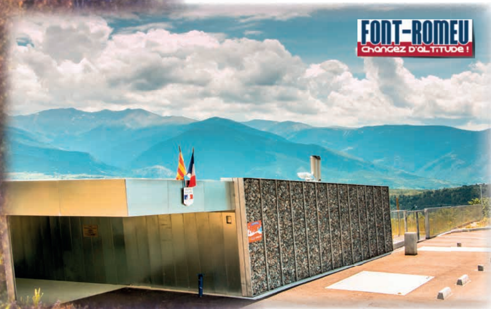
Groupe scolaire de Font-Romeu