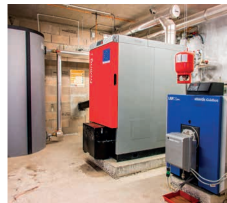
Fröling, 90 kW

1h par semaine durant la saison de chauffe (surveillance, nettoyage, évacuation bac à cendres, suivi administratif)