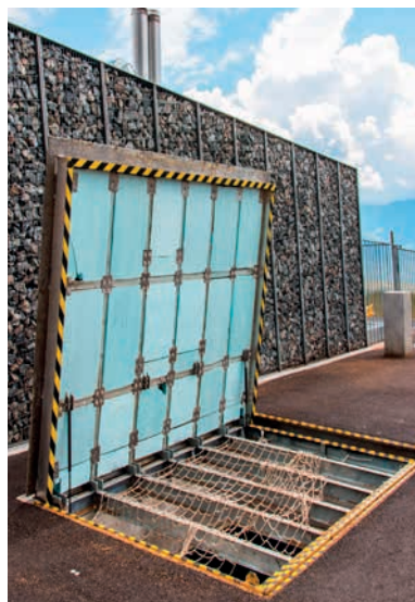
Trappe carrossable du silo