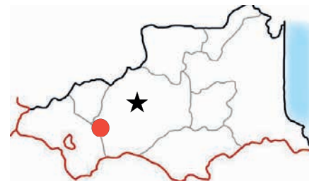
Groupe scolaire de Font-Romeu