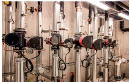
Départ réseau de chauffage et d'ECS