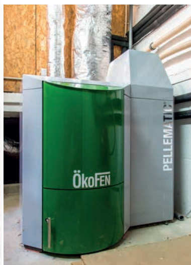
Chaudière ÖkoFEN, 20 kW