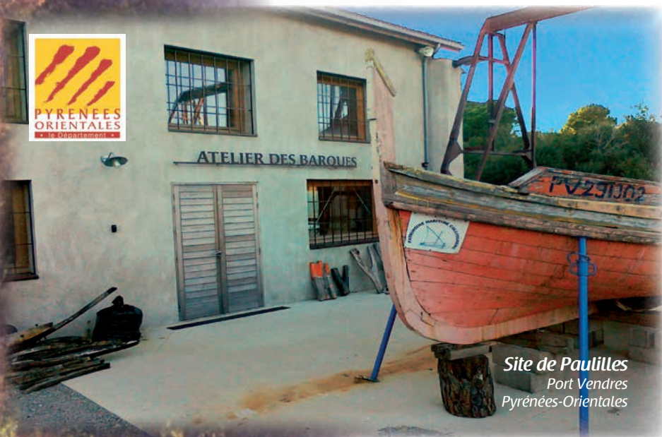
Site de Paulilles Port Vendres Pyrénées-Orientales