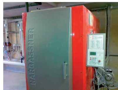
Chaudière Hargassner 150 kW