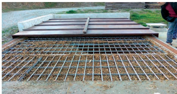
Trappe coulissante et grille de protection du silo enterré

Consommation : 65 MAP/an Energie produite : 65 000 kWh/an Prix du kWh : 0,025 € H.T. entrée chaufferie Quantité de cendres produites : 150 l/an utilisées en épandage agricole