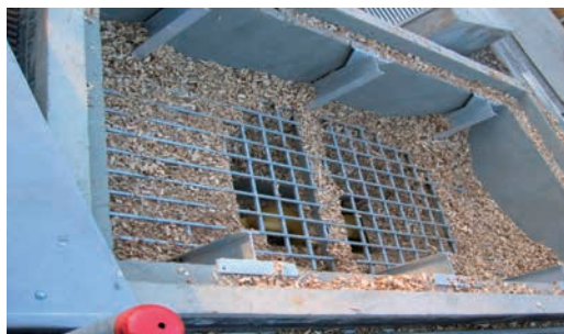
Trémie de chargement du silo enterré

Consommation : 55 MAP/an Energie produite : 55 000 kWh/an Prix du kWh : 0,04 € H.T. entrée chaufferie Quantité de cendres produites : 130 l/an utilisées en épandage agricole