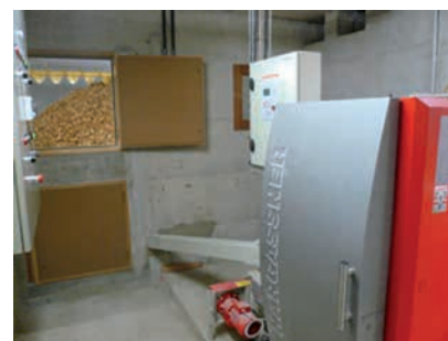
Chaudière Hargassner 45kW alimentée par une vis sans fin

Temps passé pour l'entretien: 5 minutes par jour