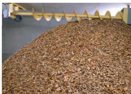
Remplissage du silo par vis horizontale depuis la trémie