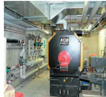
Chaudière KÖB, 300 kW

Temps passé pour l'entretien: 1,5h /semaine