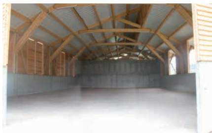
Vue intérieure du hangar

Consommation : 850 MAP/an Energie consommée : 865 000 kWh/an Prix du kWh (entrée chaufferie) : 21€ HT/MAP 0,0204€ HT/kWh Quantité de cendres produites : 1,5 t/an utilisées en épandage agricole