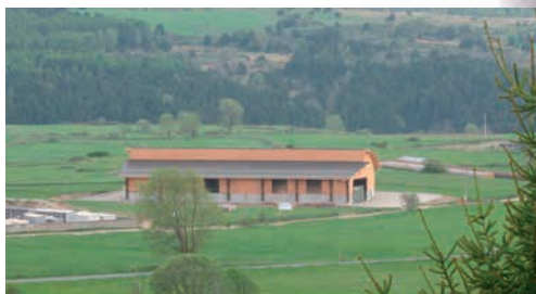
Stockage Bolquère-Pyrénées 2000