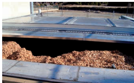
Silo semi-enterré avec capot coulissant

Lieu de stockage : hangar de stockage communal Distance : 1,5 km Fournisseur : auto-approvisionnement Rythme d'approvisionnement : 3 livraisons par mois en moyenne