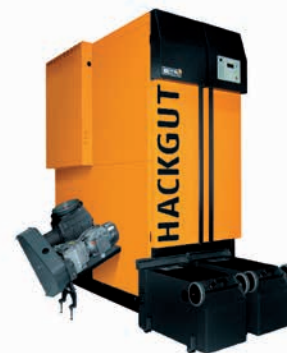
ETA HACK 200, 195 kW

Temps passé pour l'entretien 1,5h par semaine (Surveillance, nettoyage, évacuation bac à cendres, suivi administratif)