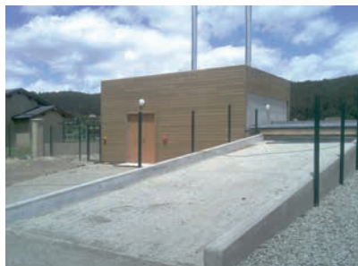
Local chaufferie et rampe d'accès au silo

Consommation : 394 MAP/an (prévisionnel) Energie consommée : 393 600 kWh/an Prix du kWh : 21€ HT/MAP 0,0204€ HT/kWh Quantité de cendres produites : non connu