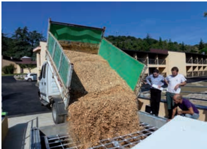
Bennage gravitaire dans le silo

Lieu de stockage : Hangar Communal de Sournia Distance : 300 m Fournisseur : auto-approvisionnement Rythme d'approvisionnement : 35 MAP toutes les 3 semaines en moyenne