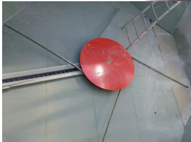
Dessileur à bras rotatifs et vis sans fin

Consommation : 263 MAP/an (prévisionnel) Energie consommée : 301 300 kWh /an Energie produite : 258 640 kWh /an Prix du kWh : 2,8 c€ TTC entrée chaufferie Quantité de cendres produites : environ 1 t /an