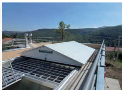
Silo semi-enterré de 70m 3 avec capot coulissant