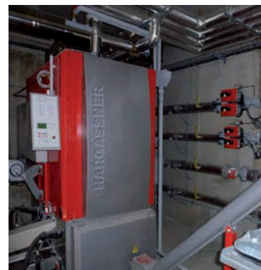
HARGASSNER HSV 150 WTH, 149 kW

Temps passé pour l'entretien 1h par semaine (Surveillance, nettoyage, évacuation bac à cendres, suivi administratif)